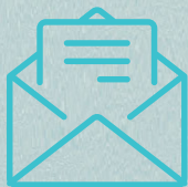
Onder enveloppe steken