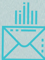
Verzending per post

Via het communicatieplatform van Click & Post kunt u niet enkel documenten versturen per post maar ook aangetekende brieven, SMS'en, e-mails en/of faxen versturen. Dankzij dit platform kunnen uw medewerkers de bedrijfsactiviteiten gewoon verderzetten, en dit van waar ze zich ook bevinden. Daarbovenop bent u niet gebonden aan vaste maandelijkse kosten, u betaalt enkel wanneer u het gebruikt!